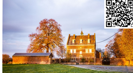
3 - Le couvent