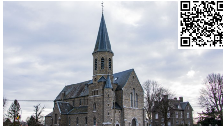
4 - L'église (extérieur)