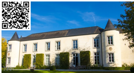
1 - Le château d'Avin