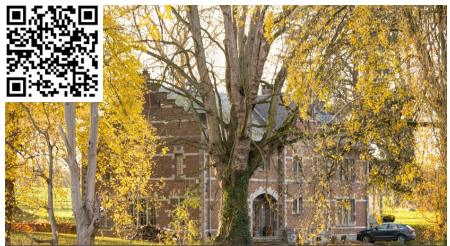
2 - Le manoir Moncheur