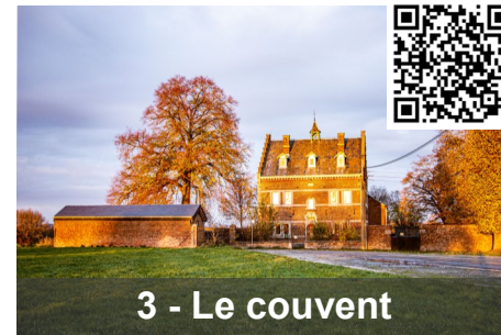
3 - Le couvent