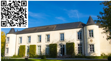
1 - Le château d'Avin