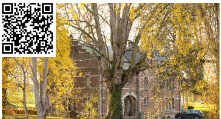
2 - Le manoir Moncheur