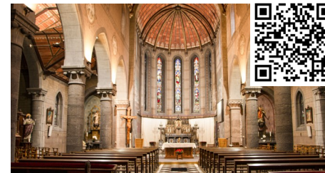
5 - L'église (intérieur)