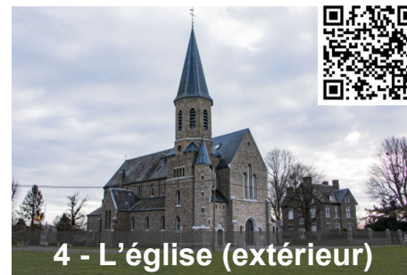
4 - L'église (extérieur)